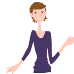
投与スケジュール