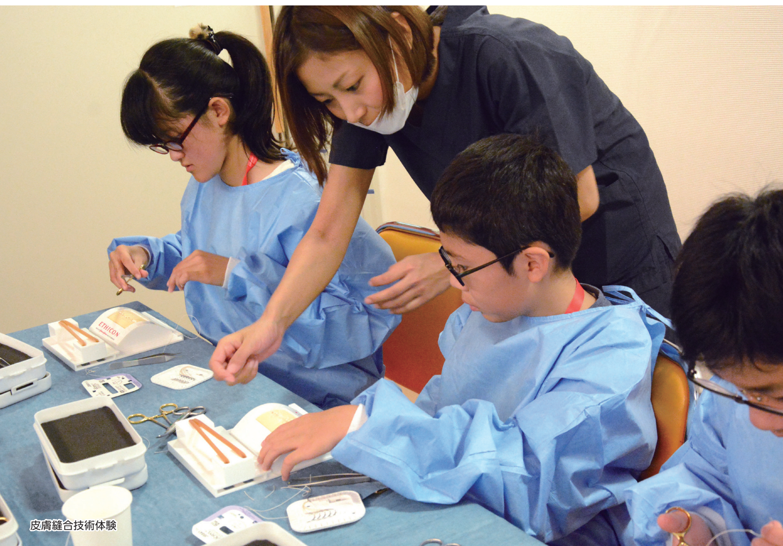
皮膚縫合技術体験