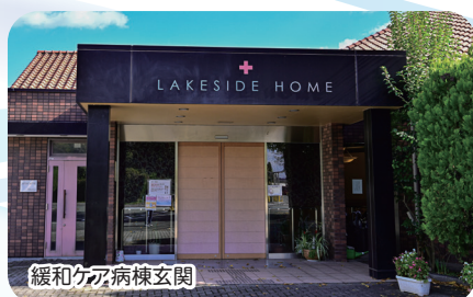
緩和ケア病棟玄関