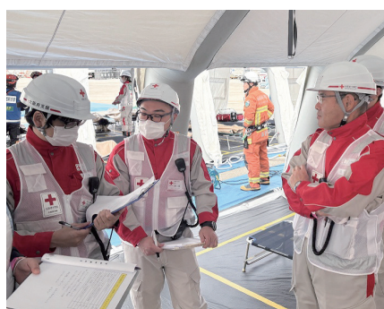
被災状況の情報共有