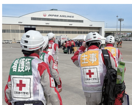
大阪国際空港へ向かう救護班

今後も赤十字として、いつ何時起こるかもしれない地震災害等に備えて関係機関と協力し、災害救護訓練に取り組んでいきます。