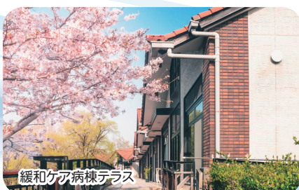
緩和ケア病棟テラス