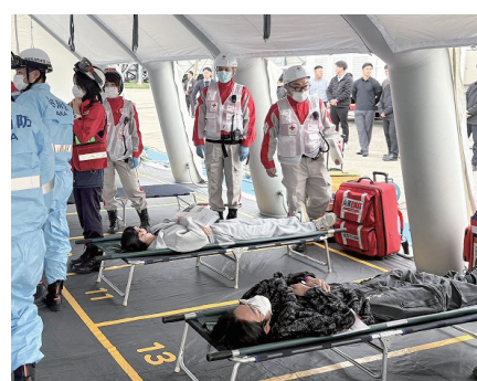
応急手当が完了し、搬送待ちの状態