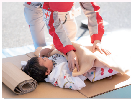
避難所の知恵袋体験