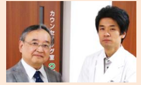
(当院玉田副院長と、澤木院長)