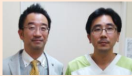
(当院消化器科神田部長と、山野院長)